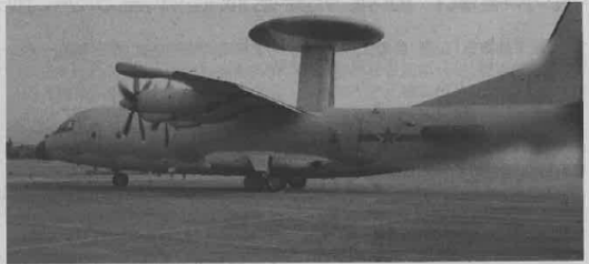
东部战区新闻发言人施毅陆军大校表示,8月15日,中国人民解放军东部战区在台岛周边海空域组织多军兵种联合战备警巡和实战化演练。这是针对美台继续玩弄政治把戏、破坏台湾和平稳定的严正震慑。战区部队将采取一切必要措施,坚决捍卫国家主权和台湾地区和平稳定。 东部战区

说,中国人民解放军东部战区在台岛周边海空域组织多军兵种联合战备警巡和实战化演练,就是对美台勾连挑衅的坚决回击和严正震慑。吴谦强调,我们正告美方和民进党当局:“以台制华”注定失败,“倚美谋独”自取灭亡。逆历史潮流而动、违背全体中国人民意志、阻挠中国统一进程的任何图谋和行径都必将以失败而告终。中国人民解放军将持续练兵备战,坚决捍卫国家主权和领土完整,坚决粉碎任何形式的“台独”分裂和外来干涉图谋。 国台办发言人马晓光15日在答记者问时表示,美国某些政客和国会议员窜访中国台湾地区是违背美方在台湾问题上作出的严肃承诺、蓄意破坏台海地区和平稳定的又一例证。这种错误行为严重违反一个中国原则和中美三个联合公报规定,我们对此次坚决反对。马晓光说,我们捍卫国家主权和