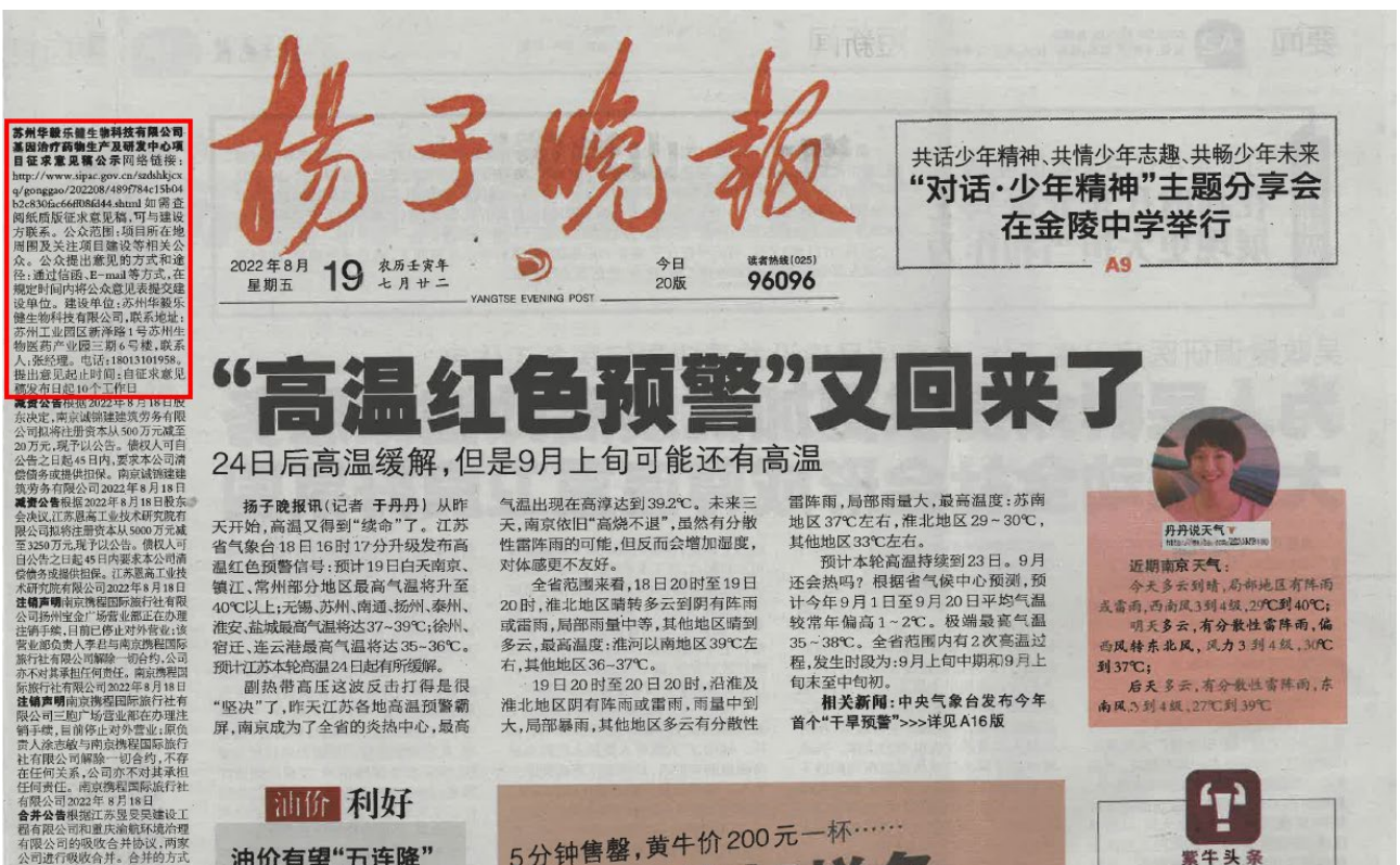
图 3.2-3 第二次报纸公示