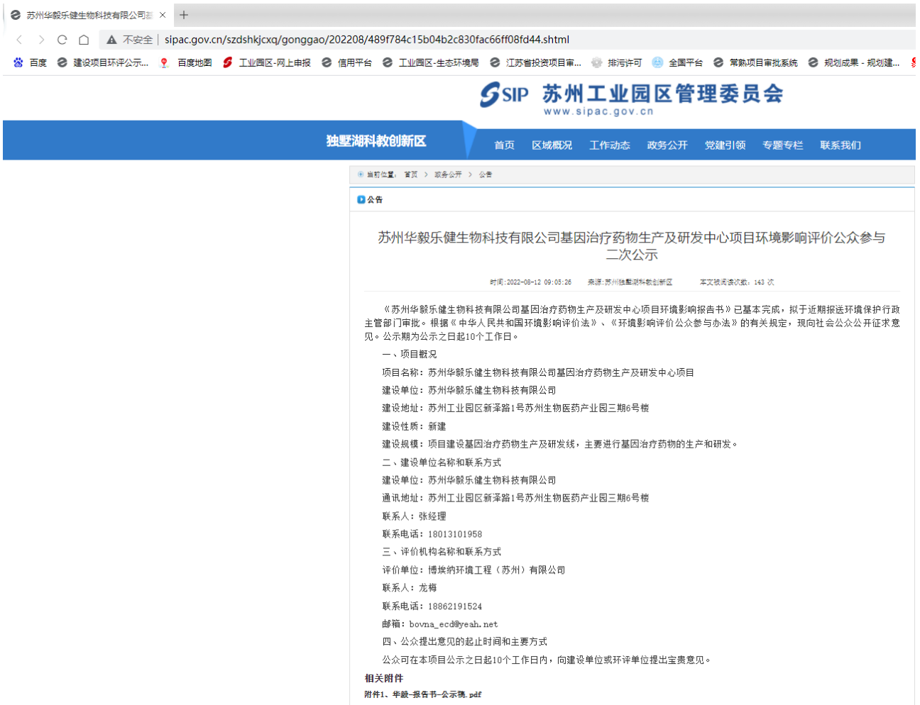
图 3.2-1 第二次公示网络截图