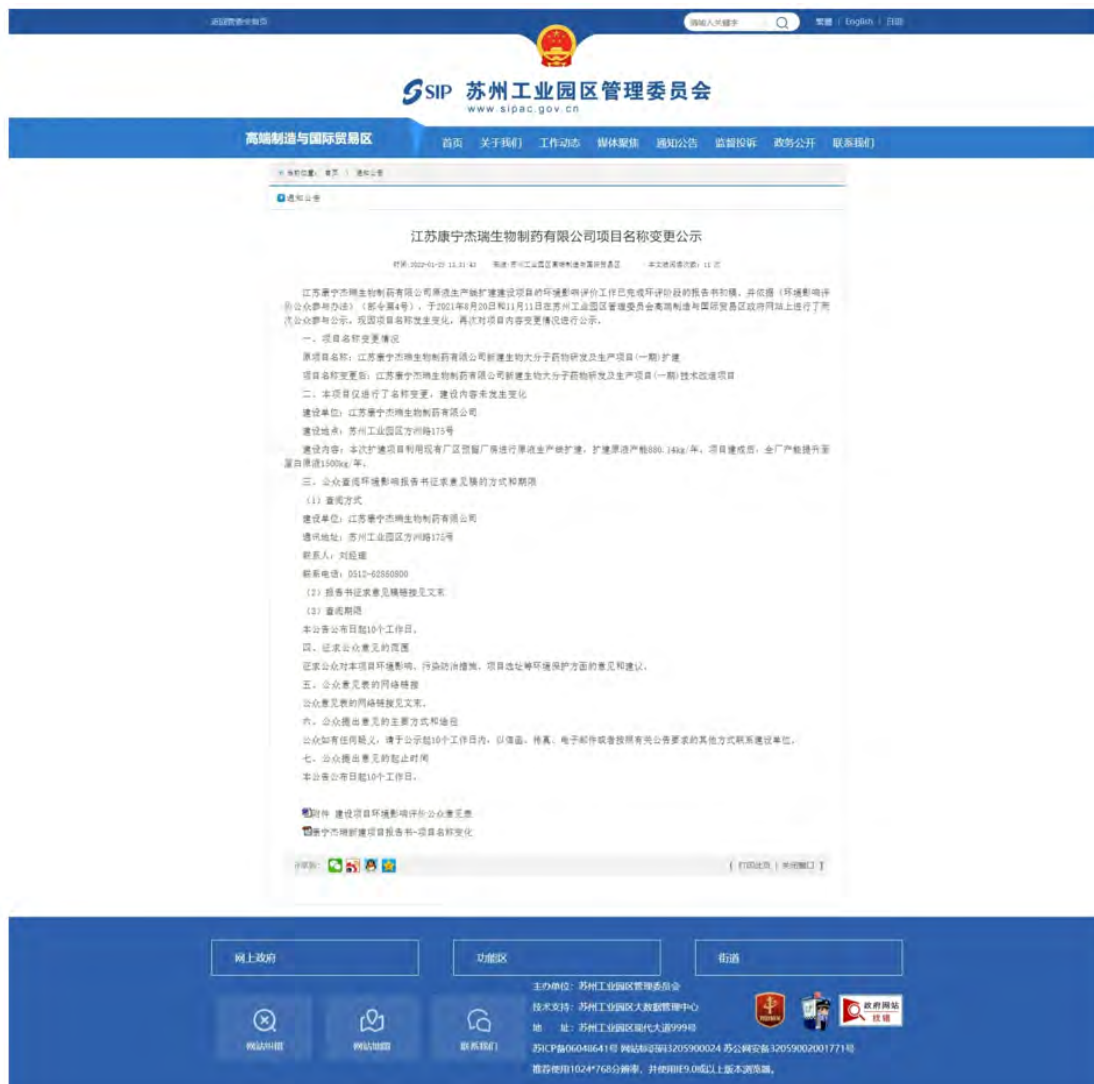
图 4-1 公示网络截图