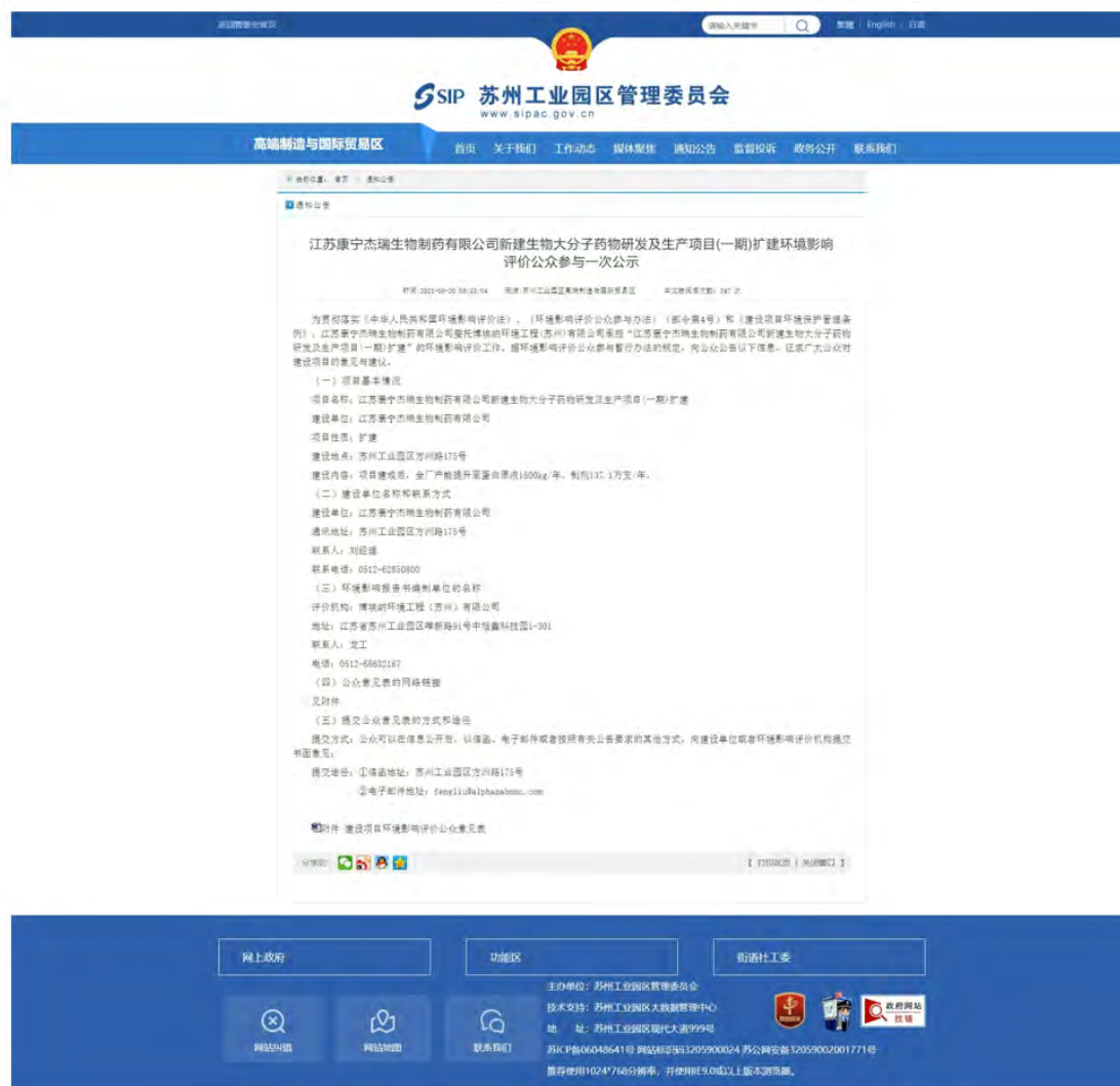
图 2-1 首次公示网络截图

2021年8月20日，在苏州工业园区管委会网站上进行第一次公示，发布时间在10个工作日以上，第一次公示截图如下。