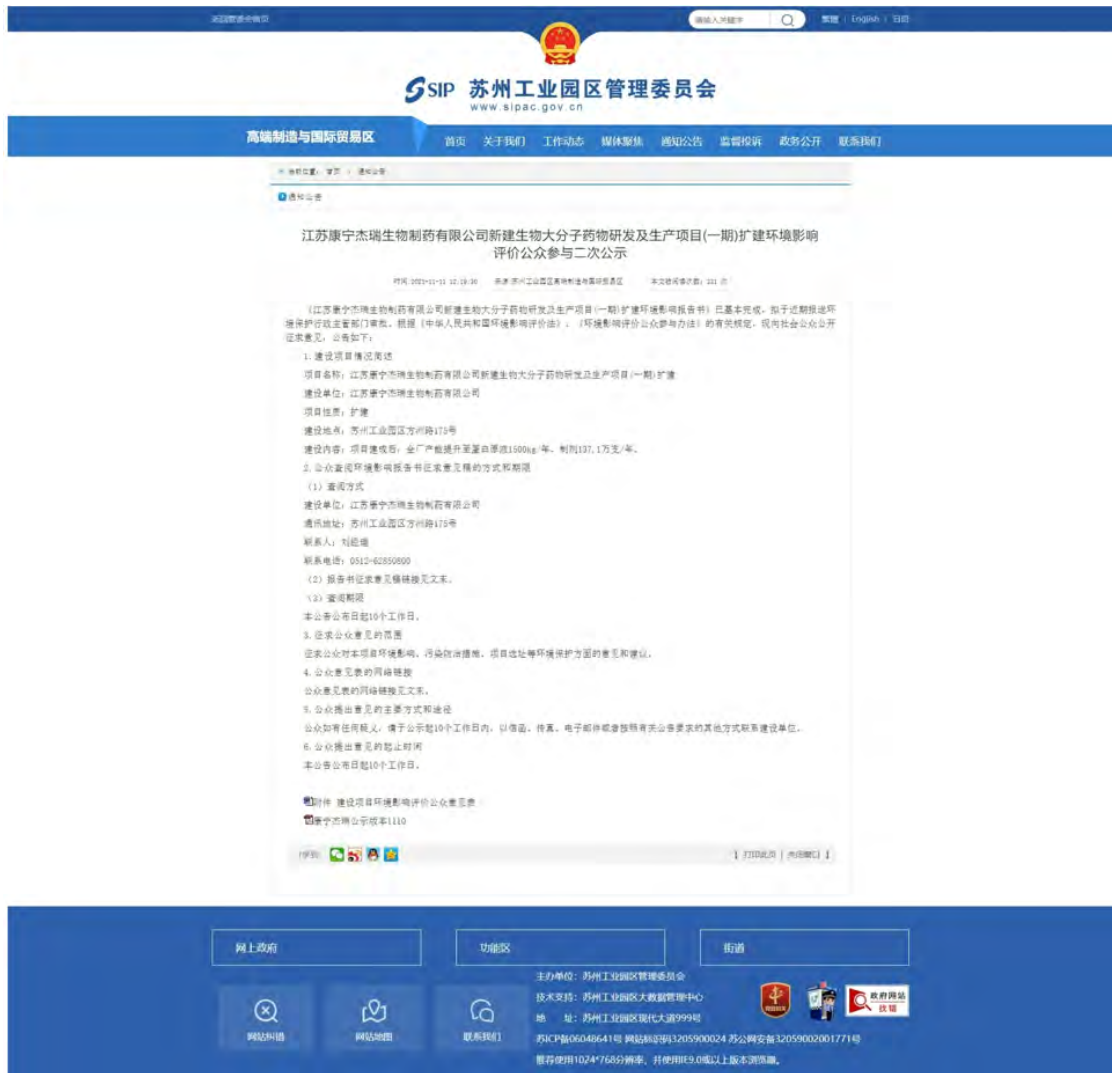
图 3-1 征求意见稿网络公示截图