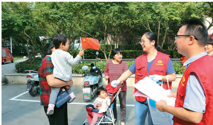
2020年9月25日,胜浦街道“蜂巢行动”在滨江苑社区开展

垃圾分类。 按照园区生活垃圾分类工作总体部署,围绕基础设施、管理体系、宣传教育等方面细化具体措施,推动工作开展。在主干道路口、社区出入口等位置制作标语、标牌,利用公交站台广告、电子屏、微信公众号等载体,宣传、普及垃圾分类知识,发放宣传折页约5万份,提升居民垃圾分类知晓率。发挥党组织、党员带头示范作用,开展“蜂巢行动”“光盘行动”等活动。推进“三定一督”模式和投放配套设施建设,25个住宅