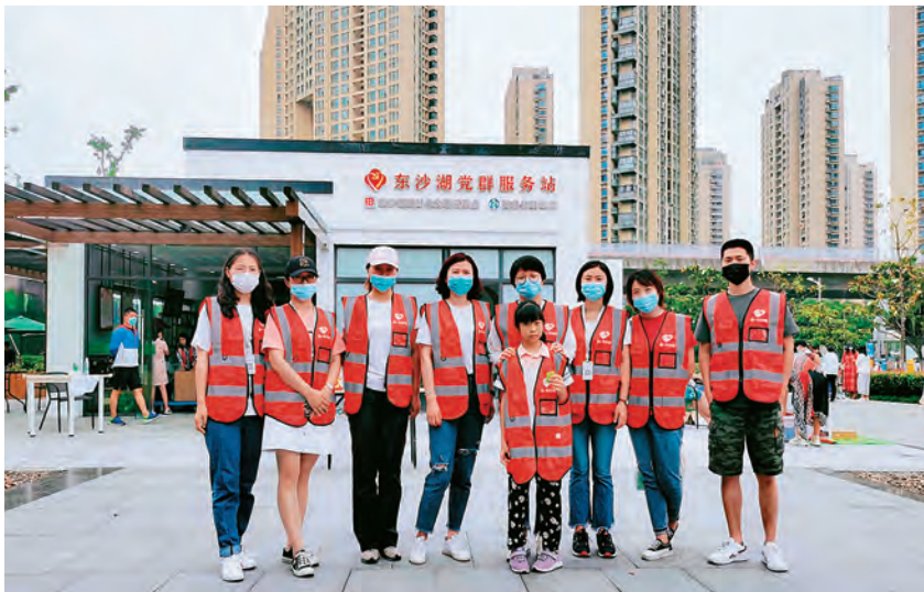
2020年6月20日,东沙湖党群服务站爱心义卖活动举办

文体活动。开展各类文体活动,丰富群众文化生活。配合园区举办广场舞、歌唱器乐大赛、“艺术走近你 艺术进社区”等活动,惠及居民