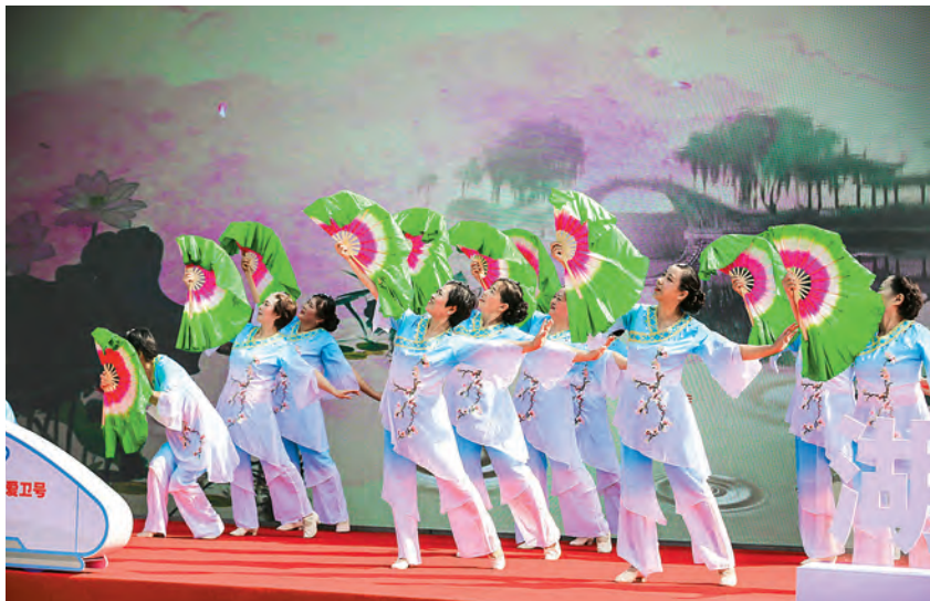
2020年10月17日，“健康园区”湖西站广场文艺演出举办

【特色工作】 2020年，湖西社工委在夯实社区服务的基础上，不断总结经验、打造亮点，提升湖西品牌特色。