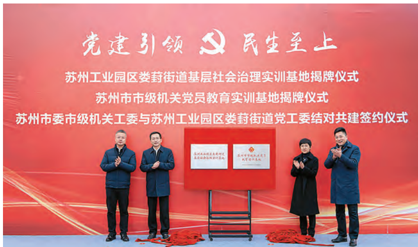
2020年12月15日,苏州工业园区娄葑街道基层社会治理实训基地揭牌仪式举行 (娄葑街道 供稿)

教育工作。 社区教育中心在街道层面设立学习中心,在24个社区设立学习点,逐步构建“街道社区教育中心—社区居民学校”二级办学体系,开设公益课程56门,服务居民2261人。探索创新老年闲暇教育,利用24个社区的场地和设施资源,采用与社区、相关教育培训机构共建模式,实施面向老年居民的休闲类教育。在全民学习活动展开期间,开展活动项目30个126场,参与群众2万余人次。重视学前教育发展,出台《关于加强娄葑街道幼教人才队伍建设的实施意见》,解决幼教难题。培养市、区教坛新秀39人、教学能手40人、学科带头人13人,幼教骨干教师占比25.1%。各个社区联合辖区内幼儿园开展0—3岁幼儿早教活动17场,参加活动幼儿250余人。幼儿园省、市级教育科