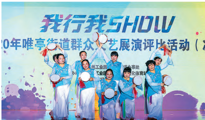
2020年12月12日,“我行我SHOW”2020年唯亭街道群众文艺展演评比活动(决赛)举办 (唯亭街道 供稿)

社会保障。 做好退管工作,纳入社会化管理的退休老人22995人,通过信息采集全部纳入退管系统。组织成立退管人员自管小组,组织退管活动8场。组织退休人员健康体检,走访慰问高龄、孤寡老人228人次,困